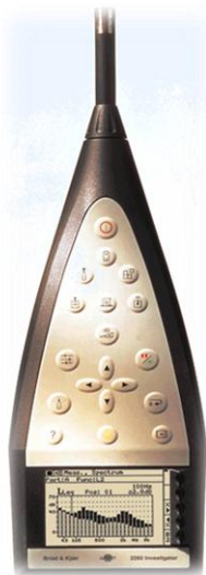
Figura 1.1– Sonómetro B&K 2260

O TR é medido com o auxílio de um sonómetro (Figura 1.1). O sonómetro é um instrumento que converte as variações de pressão atmosférica em níveis de pressão sonora, recorre-se a uma fonte sonora ( Brüel & Kjaer - tipo 4224, Figura 1.2) que emite um ruído rosa cujo sinal é coordenado pelo sonómetro.