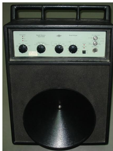
Figura 1.2– Fonte sonora B&K 4224

Cada medição normalmente é realizada à altura de aproximadamente 1,30 m. A fonte sonora emite um ruído com características aproximadas de ruído rosa, durante 10 segundos. Após cessar o ruído emitido pela fonte sonora e em simultâneo, o sonómetro regista o nível de pressão sonora recebido em cada instante, no ponto a avaliar e determina o correspondente tempo de decaimento relativamente a 30 dB (T30), nas bandas de frequência de oitava, dos 125 aos 4000 Hz.